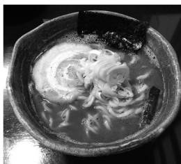
濃厚中華(大)800円(税別)

青森県民はラーメン好きが多く、私もその一人です。行きつけのラーメン屋さんの中で特に気に入っているのは「麺匠(とうぎょう)」です。