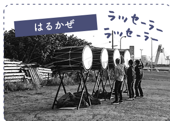
はるかぜ ラッセラー 1 ねぶたの囃子の練習風景。職員が祭り本番に向け練習中。