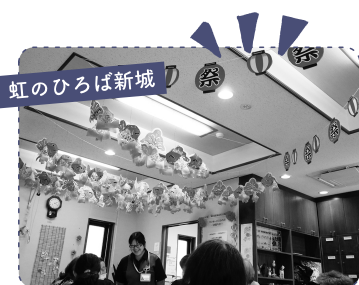
虹のひろば新城 1 金魚ねぶたの制作をしました。それぞれ個性があります。