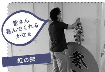
皆さん喜んでくれるかなあ 虹の郷 1 期間限定で祭りの飾りつけをしています。