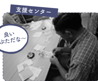
支援センター 1 利用者様と一緒に、ビーチのグリーティングカード作り。