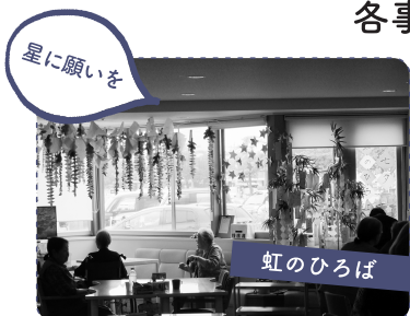
星に願いを 虹のひろば 1 施設内の飾りの様子。見ると涼しげな気分になります。