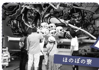
ほのぼの寮 1 ねぶた小屋見学。台上げが見れてラッキーでした。