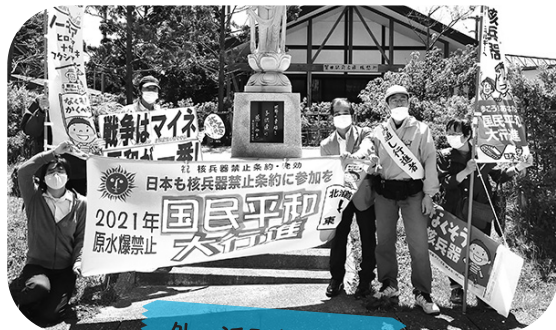
外ヶ浜町蟹田駅前

コロナ禍にて例年とは違い、自治体首長や議長への要請と庁舎前でのスタンディング行動のみとなりましたが、核兵